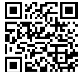
QR til link 2